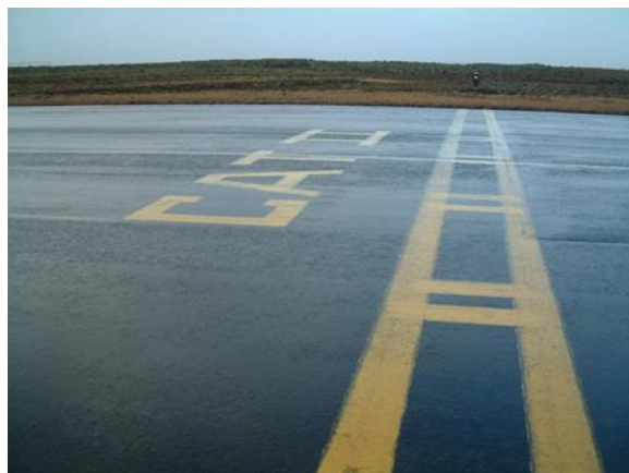
Sýnishorn af CAT II merkingu á akbraut